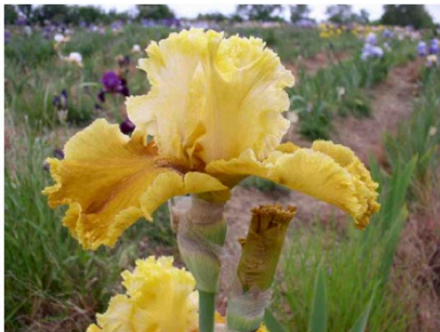
Iriseraie de Papon Iris