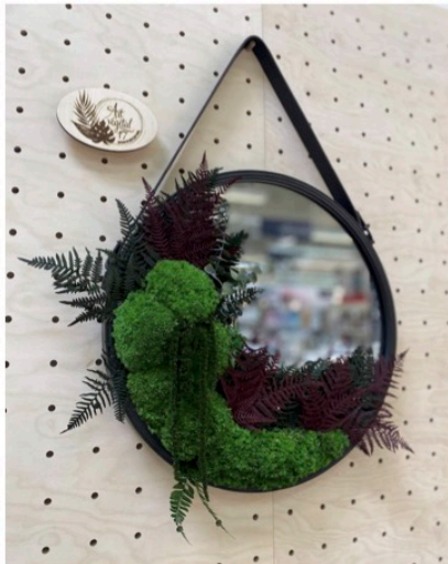
Art végétal 17 Jardinier d'art