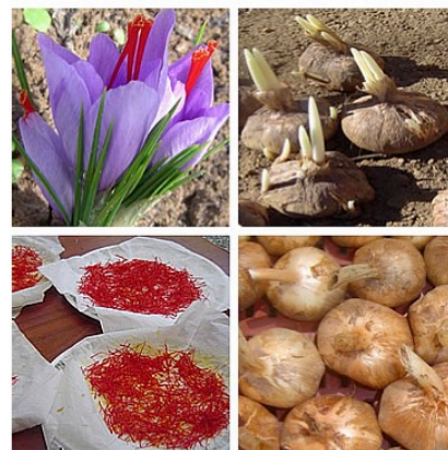
Safranière du Périgord Safran et bulbes