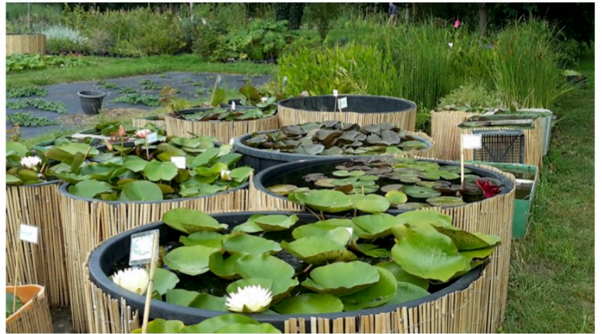
Aquatic Garden Nénuphars