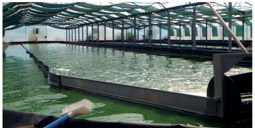
EARL CARPIO Spiruline