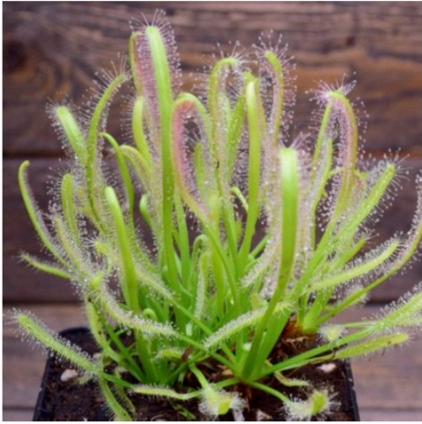
Les dents de la terre Plantes carnivores