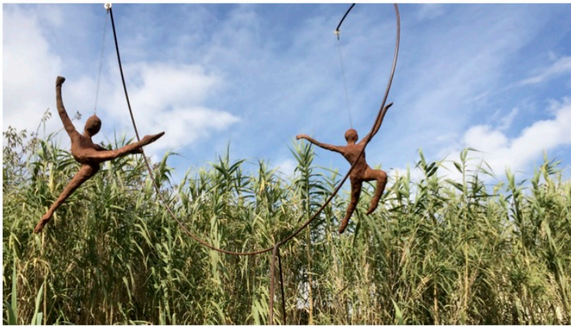
Anne Cutzach Sculptures d'extérieur