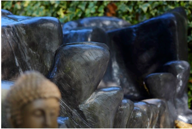
Rochers Paysagers Cascade zen