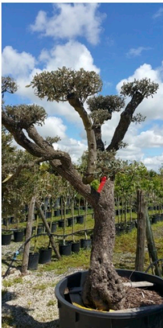
Pépinières Gillardeau Les topiaires