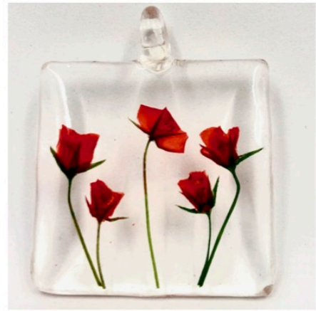
Le Petit Jardin Pendentif coquelicots